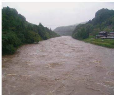
水位が上昇した名張川

青山： 例えば三重県名張市では、2009年10月の台風18号による大雨で、名張川が氾濫する恐れがありましたが、上流の3つのダム（青蓮寺ダム、比奈知ダム、室生ダム）の連携操作によって市街地への浸水を回避することができました 6) 。