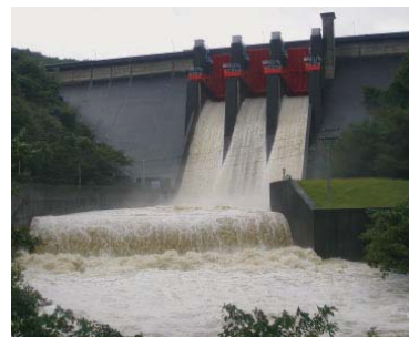
ゲート放流を行う室生ダム